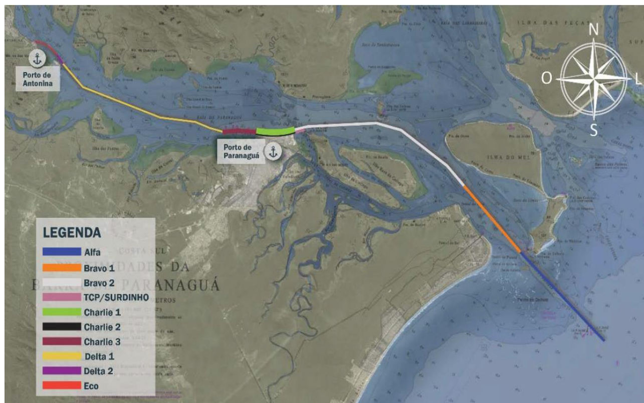
Figura 3: Acesso aquaviário ao Complexo Portuário de Paranaguá e Antonina.

O Canal da Galheta é segmentado em três trechos, Alfa, Bravo 1 e Bravo 2. Esses e os demais canais internos da Baía de Paranaguá, incluindo o canal de acesso ao Porto de Antonina, são descritos nesta seção. A Figura 3 apresenta a configuração do canal de acesso ao Complexo Portuário de Paranaguá e Antonina.