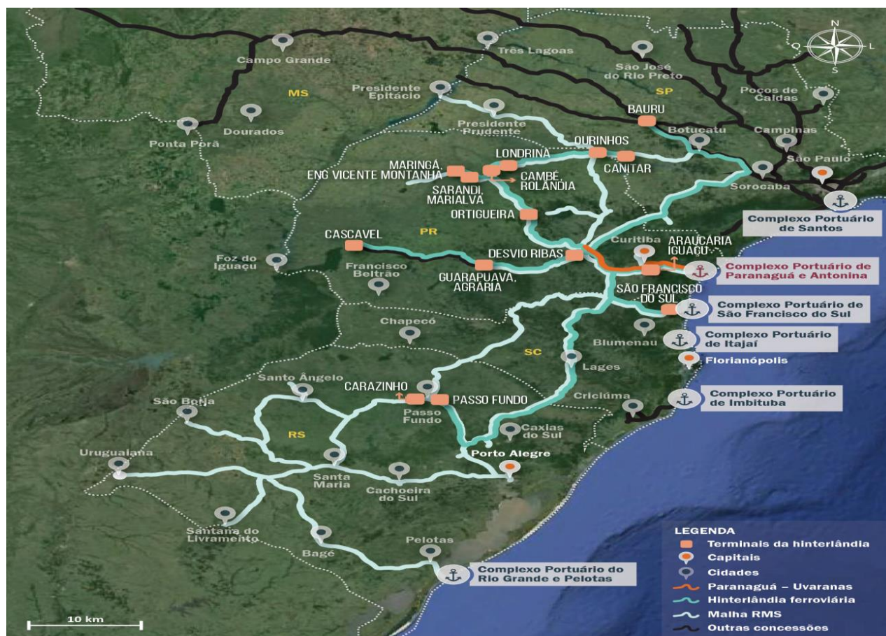
Figura 6: Hinterlândia ferroviária do Complexo Portuário de Paranaguá e Antonina.

A Malha Sul, onde o Complexo Portuário está inserido, é denominada Rumo Malha Sul (RMS), e possui 7.223 km de ferrovias distribuídas em 46 linhas (ANTT, 2015). Na Figura 6 é possível visualizar a hinterlândia ferroviária de 2016 e como esta se insere na malha ferroviária.