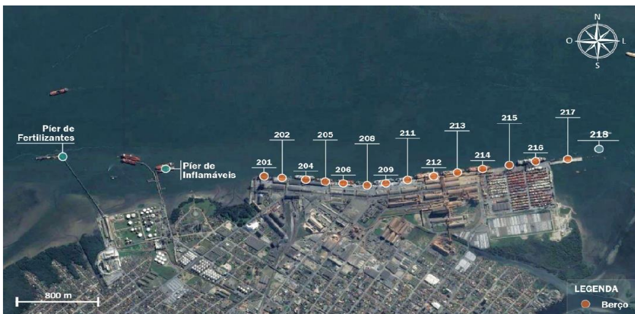
Figura 2: Localização dos Berços e Píeres do Porto de Paranaguá.

O porto dispõe de um cais público acostável, contínuo e com extensão de 3.131 m, com 14 berços para atendimento simultâneo de 12 a 14 navios, 1 berço de atracação para operações roll on-roll off com 220 m de extensão, o qual compreende 3 dolphins de atracação e 1 de amarração, totalizando aproximadamente 3.400 metros acostáveis de cais. A imagem a seguir demonstra a localização dos berços no Porto de Paranaguá.