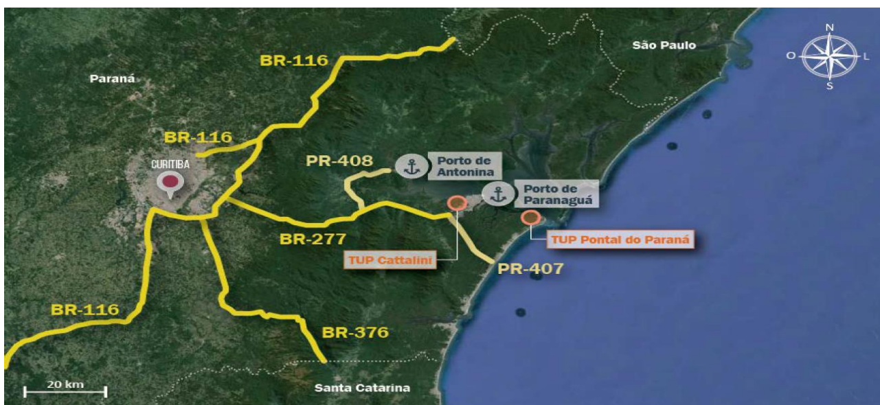
Figura 5: Vias de acesso rodoviário ao Complexo Portuário de Paranaguá e Antonina.

A BR-277 estende-se até as proximidades do Porto de Paranaguá e do TUP Cattalini, onde recebe o nome de Av. Senador Atílio Fontana. Próximo à cidade de Curitiba, essa rodovia interliga-se à BR-376 e à BR-116. Por outro lado, para acessar o Porto de Antonina, a BR-277 conecta-se com a PR-408, e, para acessar o TUP Pontal do Paraná, interliga-se à PR-407.