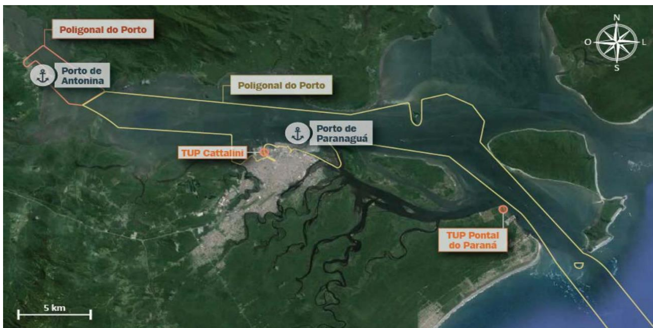
Figura 1: Localização do Complexo Portuário de Paranaguá.

O porto dispõe de um cais público acostável, contínuo e com extensão de 3.131 m, com 14 berços para atendimento simultâneo de 12 a 14 navios, 1 berço de atracação para operações roll on-roll off com 220 m de extensão, o qual compreende 3 dolphins de atracação e 1 de amarração, totalizando aproximadamente 3.400 metros acostáveis de cais. A imagem a seguir demonstra a localização dos berços no Porto de Paranaguá.