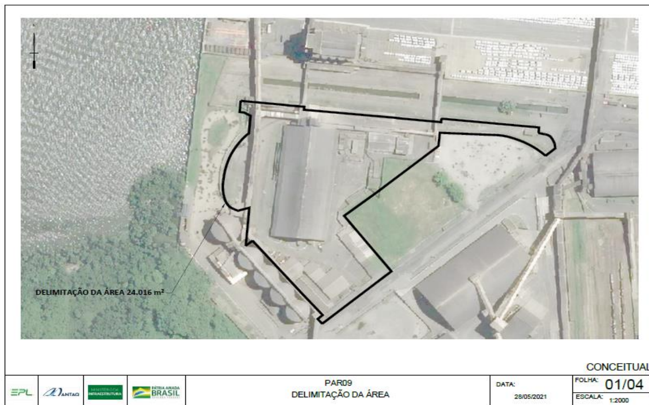
Figura 7: Localização área de arrendamento PAR09 no Porto de Paranaguá.

A figura a seguir apresenta imagem aérea da área de arrendamento PAR09 .